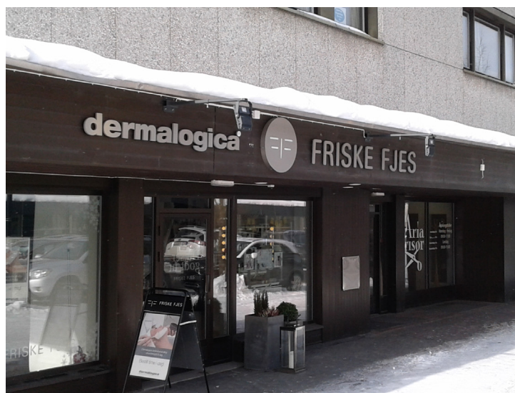
Bilder over: Eksempler på freste bokstaver.