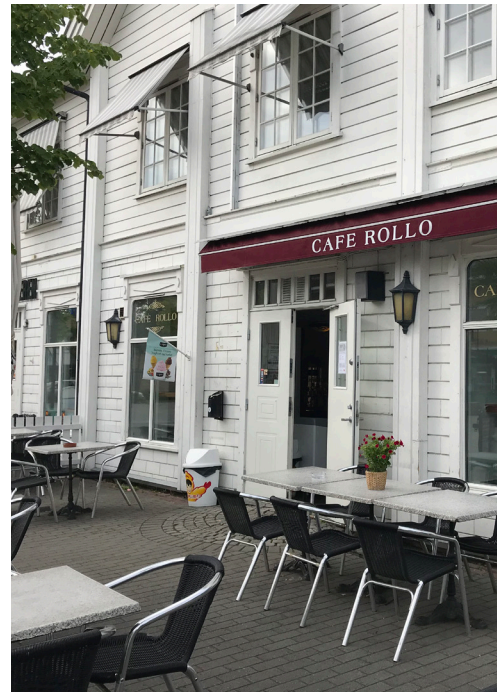
Bilder over: Eksempler på markiseskilt.