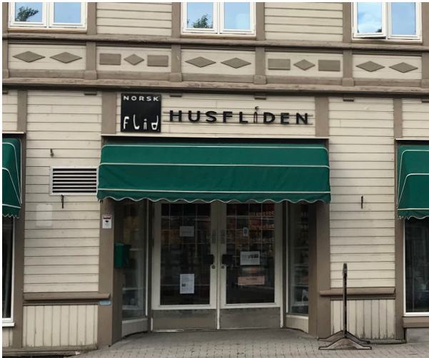
Skilt som er tilpasset bygningens arkitektoniske detaljer, og som har hatt hensyn til fasadebånd mellom 1. og 2. etasje.

2.5 Skilt på arkitektoniske detaljer på fasaden som søyler og pilastre og andre karakteristiske fasadelementer tillates ikke.