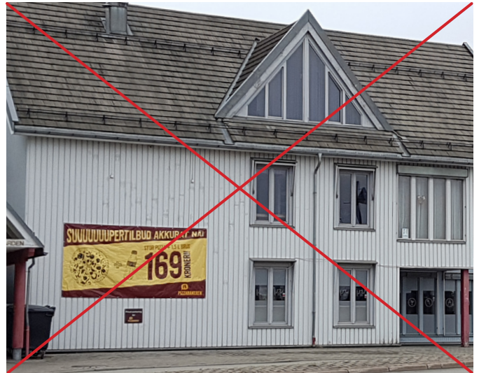
Temporært skilt/produktreklame på banner som vist her tillates ikke.

2.6 Skilt skal tilfredsstillende kravene til trafikksikkerhet og viktige siktlinjer inn og ut av byrom og gater.