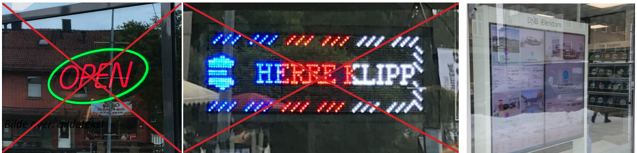
Bilder til venstre: Eksempler på blinkende, bevegelige skilt jf. 2.11 som ikke er tillatt.