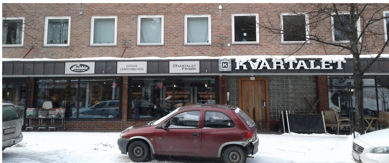
Eksempler på freste bokstaver og enhetlig plateskilt tilpasset fasade/baldakin.