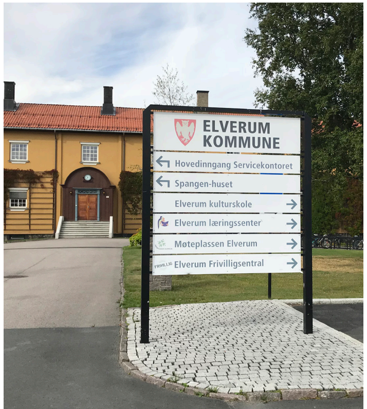
Eksempel på orienteringsskilt jf. 2.16.