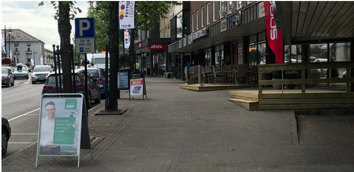
Løsfotoreklame plassert i møbleringssone.