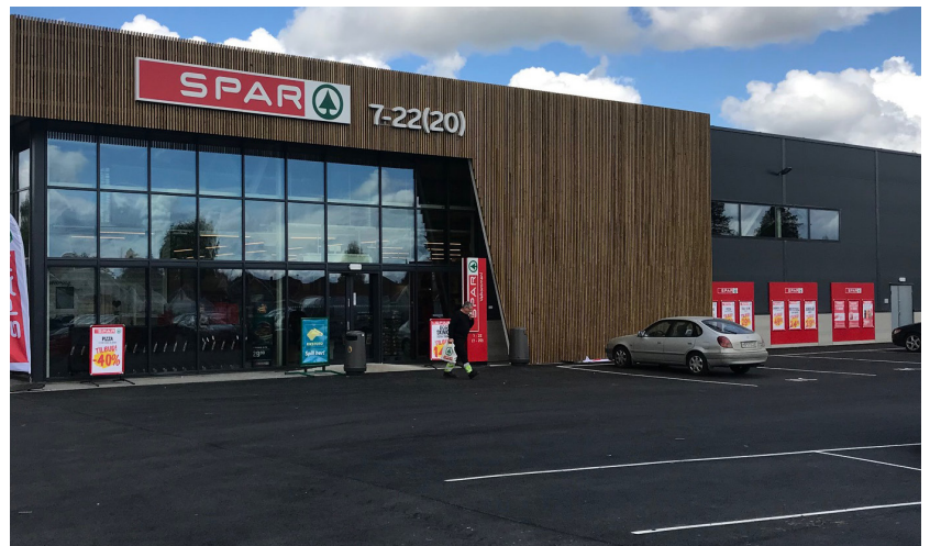
Eksempel på skilting som retter seg mot parkeringsplass og som er av begrenset omfang.