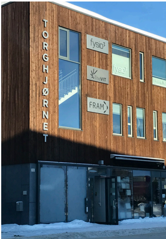
Eksempel på skiltplan jf. 2.15.