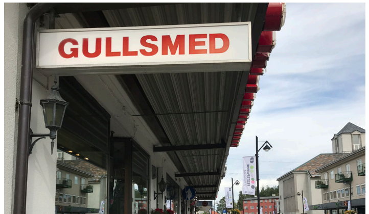
Bilder over: Eksempler på nedhengsskilt. Skilttypen kommer sjelden i konflikt med fasaden, og gir god synbarhet langs veg/fortau.