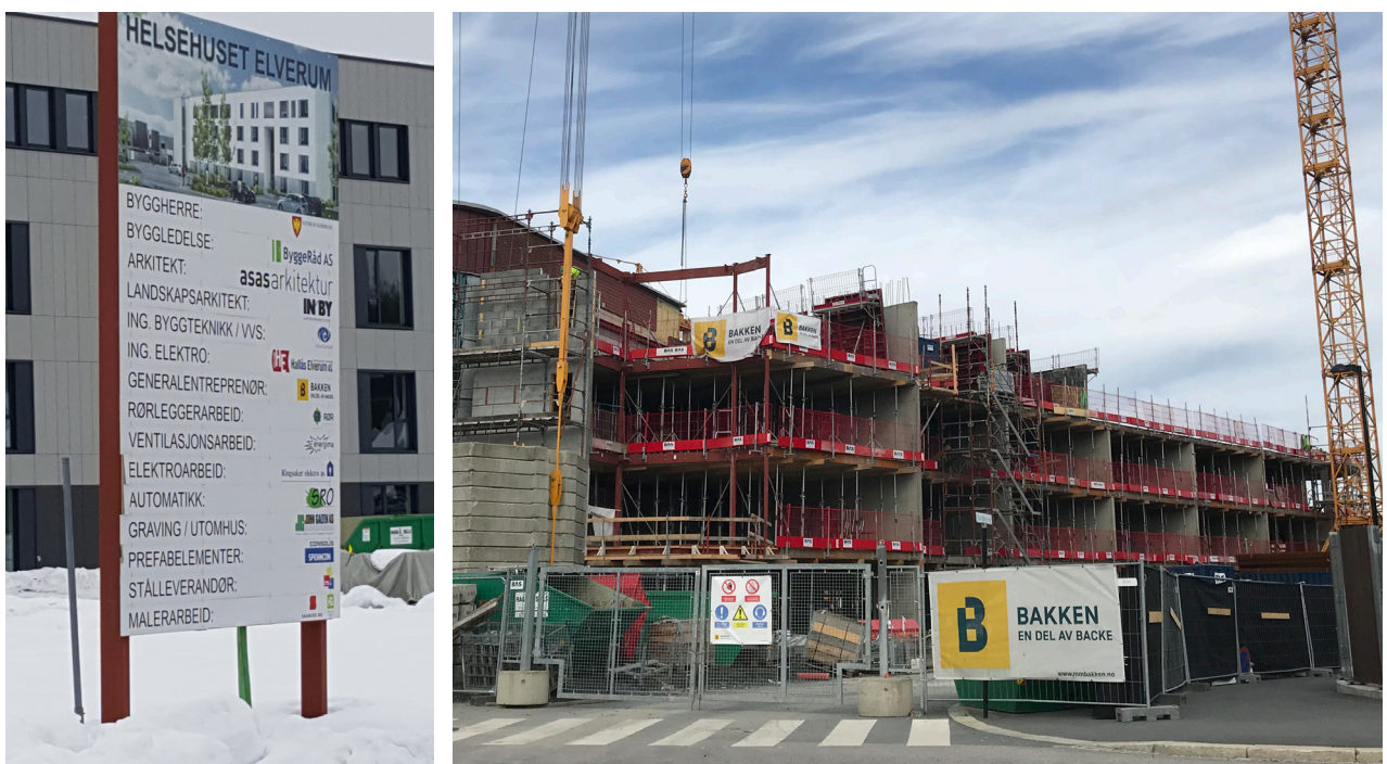
Bilder over: Eksempler på skilt i tilknytning til byggearbeider, for én og flere aktører.