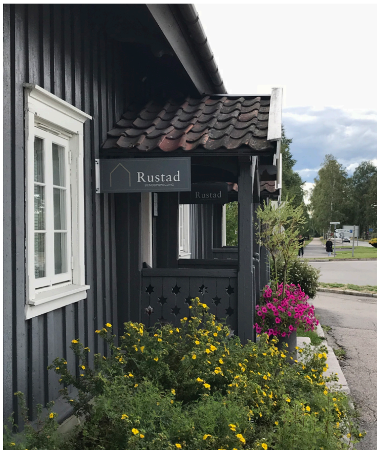
Bilder over: Eksempler på uthengskilt. Skilttypen kommer sjelden i konflikt med fasaden, og gir god synbarhet langs veg/fortau.