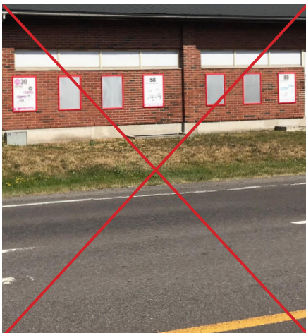
Utskiftbare produktreklamer som ikke tillates på fasader. Benyttes ofte av kjedebutikker.

2.8 Faste reklameskilt på bygninger med priser og skilting ved salgskampanjer tillates kun hvor skilting retter seg mot parkeringsplass for foretaket/bygningen. Skiltingen må være av begrenset omfang slik at det tilpasses fasaden. Utover dette kan mindre skilt beregnet for gående med opplysninger om produkter og priser tillates. Fremmedreklame tillates ikke.