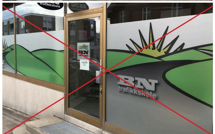
Bilder til venstre: Vindusdekor på deler av vindusflate hvor det er benyttet frosting/diskre farger.