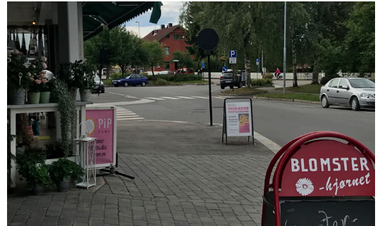
Her ivaretas ikke rettlinjert bevegelsessone på god måte for fremkommelighet. Skilt bør her samles på én side.