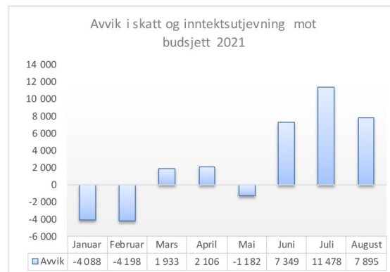
Figur: Avvik mellom inntektsutjevning og budsjett.

Ved utgangen av august viste regnskapet at kommunen hadde fått inn 20,6 millioner kroner i merinntekter på skatt og inntektsutjevningen. Dette er høyere enn prognosene som ligger i revidert nasjonalbudsjett. Det er også merinntekter når vi legger prognoser i revidert nasjonalbudsjett til grunn.