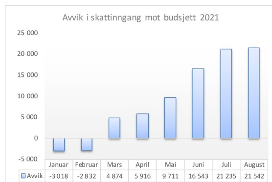
Figur: Avvik mellom skatteinngang og budsjett.

Ved utgangen av august var inntektsutjevningen i rammetilskuddet 0,9 millioner kroner under periodisert budsjett.