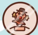
Troll i eske Bronse